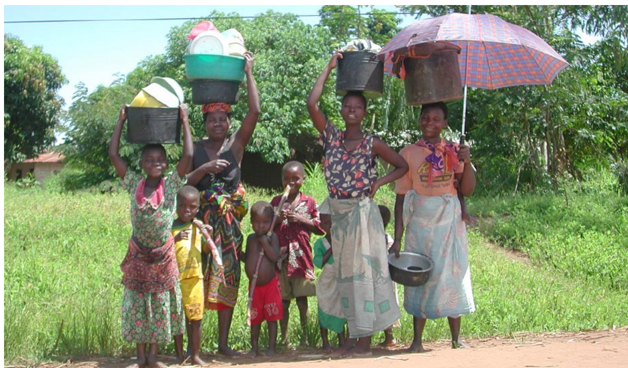
Typische Strassenszene in der Umgebung von Phalombe

Die frei in die Gegend hustenden Patienten mit Tuberkulose (TB) sind zwar in einem separaten TB-Zimmer untergebracht, doch das Pflegepersonal betritt den Raum für sämtliche pflegerischen Verrichtungen ohne Mundschutz, Überschürzen, etc. Ich frage die Krankenschwes-