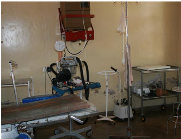
Dringender Renovationsbedarf für den existierenden Operationssaal

Das Projekt Patientensäle ist noch nicht vollständig abgeschlossen – wir erwarten die letzte Bauabnahme und Schlussrechnung in diesem Frühling – und schon sind der erste Kostenvoranschlag und die Pläne für den Bau des neuen Operationssaals bei uns eingetroffen. Ein neuer OP ist ein dringliches Spitalprojekt, welches schon vor vielen Jahren im Entwicklungsplan vorgesehen war und jetzt als erste Priorität für die Verbesserung der Infrastruktur ansteht.