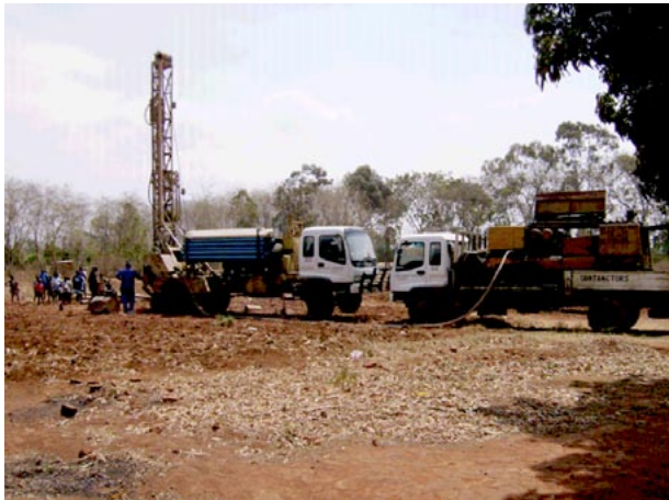
Zwei Bohrlöcher werden in der Nähe des Spitals gebohrt

Schon im Spitalmeeting Ende Mai 2007, an welchem Silvia Planzer teilnahm, wurde die katastrophale Wassersituation im Spital Phalombe angesprochen. Fast kein Wasser kann aus den Bohrlöchern gefördert, zudem ist das Leitungssystem in einem desolaten Zustand. Für uns eine groteske Situation; versuchen Sie einmal, sich vorzustellen, ein paar Tage ohne Wasser auszukommen. In Afrika leider ein häufiges Problem. Der Vorstand von Pro Phalombe hat nach Überprüfung der Situation entschieden, die «alten» Löcher nicht mehr weiter anzubohren. Es wurde umgehend ein Kredit über € 18 450 bewilligt, um zwei neue Bohrlöcher zu bohren. Gleichzeitig mussten neue Leitungen zum Spital verlegt und die existierenden Wassertanks repariert werden. Es gibt wieder genügend Wasser!