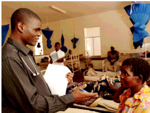
Visite im neu renovierten Frauensaal

Beim Schreiben dieser Zeilen versuche ich zusammenzufassen, was schon alles vom Verein Pro Phalombe für unser Spital geleistet wurde, und ich bin verblüfft über den grossen Einsatz aller Vereinsmitglieder und fühle eine grosse Dankbarkeit mit den gleichgesinnten Menschen in der Schweiz.